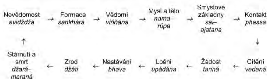
Diagram 1. Matice podmíněného vznikání

1) Nevědomost ( avidžžá ) nebo jinak řečeno absence vhledu do povahy vlastních